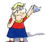
ik neem afscheid